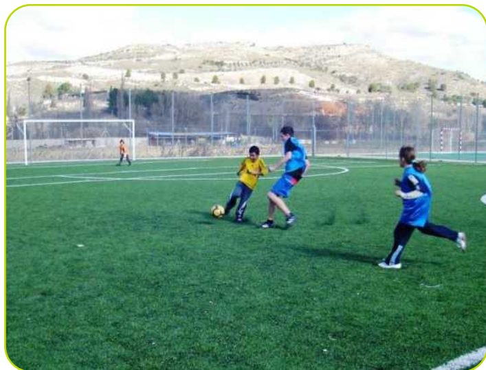
Las pistas polideportivas "Los Pradillos" se podrán alquilar durante todo el verano.

Este verano puedes disfrutar en Perales de la piscina municipal y también se pueden reservar las pistas de las distintas instalaciones deportivas en el teléfono 91 874 85 38 (horario de verano: de lunes a viernes de 12:00 a 21:00h, sábados y domingos de 10:00h a 21:00h) y así poder practicar tus deportes favoritos como el pádel, el tenis, el fútbol sala y el fútbol 11.