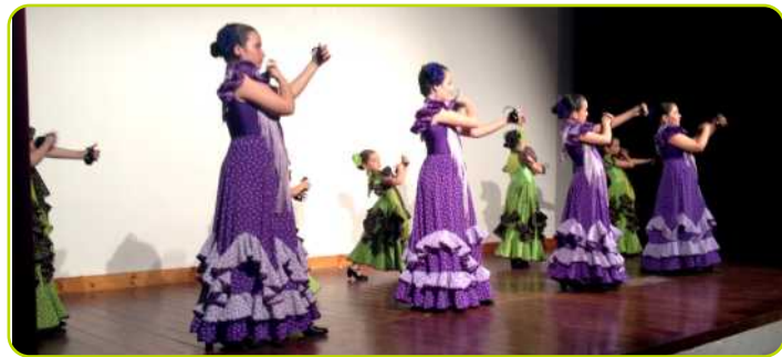
Actuación del Grupo de la Escuela Municipal de Baile y Danza.