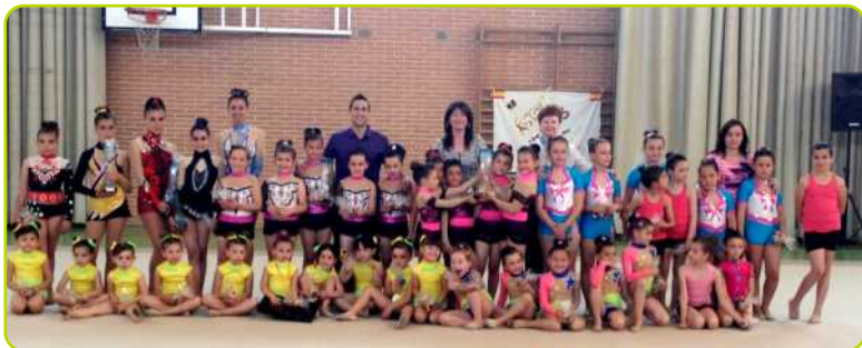
Escuela Municipal de Gimnasia Rítmica junto a la Alcaldesa y la Concejal de Deportes.

Un año más las competiciones y exhibiciones de la rítmica se ha concentrado fundamentalmente en los meses de primavera y las gimnastas peraleñas han participado en numerosos torneos, competiciones y exhibiciones no sólo a nivel comarcal y de federación, también la participación en diferentes torneos de clubes de toda la Comunidad que nos invitan debido al nivel de nuestras gimnastas.