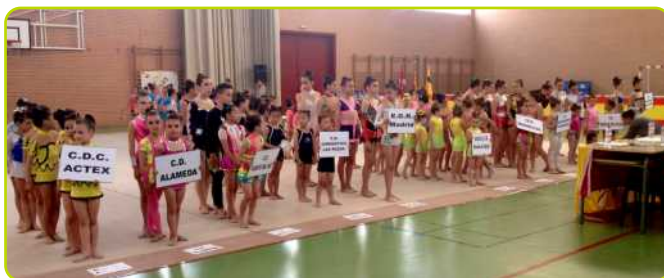
Participantes en el V Campeonato de Gimnasia Rítmica.