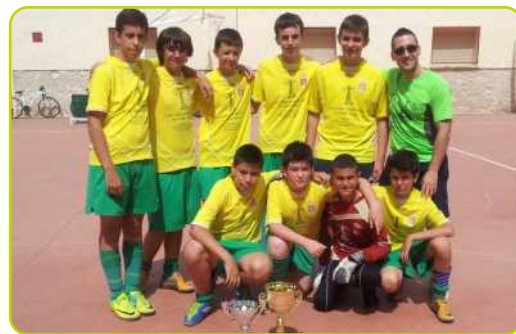
El Equipo Fútbol Sala Infantil junto al Coordinador de Deportes y sus trofeos

Un año más dar nuestra enhorabuena a todos los niños y a sus entrenadores puesto que el objetivo principal es el aprendizaje de este deporte. Y dar las gracias a todos los padres y madres que han apoyado y animado a los equipos durante toda la temporada.