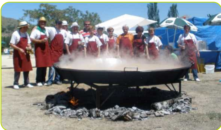
Miembros de la Hermandad de San Isidro posan junto a la gran paella realizada.

Por eso, en el mes de mayo, Perales tiene aire de celebración y fiesta, gracias al trabajo que para ello hacen las Hermandades de la Virgen del Castillo y de San Isidro.