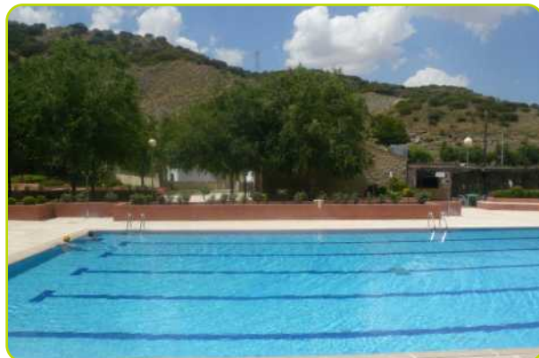
La piscina municipal abrió sus puertas el 23 de junio.

Algunos de estos servicios estarán disponibles también en la temporada de invierno. De esta manera el Ayuntamiento ha querido ampliar y facilitar el acceso a estos servicios para todos los vecinos.