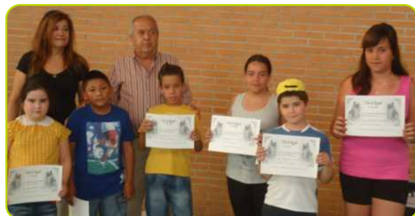
El Concejal de Área Social y la Directora del Colegio, junto a alguno de los niños participantes en las actividades de la XIII Semana sin Humo.

El Centro de Salud y el Ayuntamiento de Perales se han unido a la campaña "XIII Semana sin Humo" organizada por la Sociedad Española de Medicina de Familia y Comunitaria, que este año tenía como lema ¡Tú lo dejas, tú ganas!. Las actividades, planteadas por esta campaña tienen como objetivo sensibilizar de la importancia del abandono del tabaco para la salud, informar a los fumadores de los recursos de los que disponen para ayudarles a dejar el hábito y sensibilizar a la población de lo perjudicial que es lo que conocemos como tabaquismo pasivo. Además, los niños del Colegio Ntra. Sra. del Castillo han participado en las actividades educativas de la Semana sin Humo, entre las que se ha realizado un concurso al mejor "dibujo para dejar de fumar" destinado a los alumnos de 1º, 2º y 3º de Primaria y los alumnos de 4º, 5º, y 6º de primaria han podido participar con el mejor "lema para dejar de fumar" o la "mejor carta abierta dirigida a un fumador".