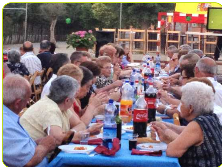
Nuestros mayores durante la merienda-cena.

A la cena también asistió el Párroco D. Eusebio y los voluntarios del móvil te ayuda, ya que gracias a ellos, muchos mayores de Perales cuentan con una atención las 24 horas en