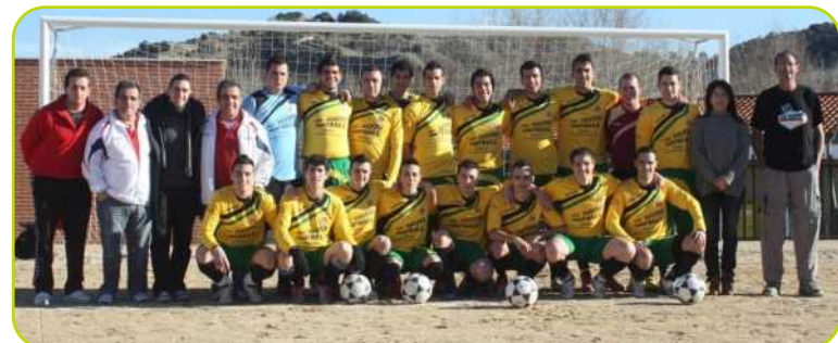
El C.D. Perales Fútbol 11, el día de la presentación de su equipamiento.

El domingo 3 de junio se disputó la 34ª jornada que cerraba la temporada en el grupo nº 9 de tercera de aficionados. El partido se jugó en el Campo Municipal de Perales con el resultado de 3-0 contra el Sporting Belmonteño.