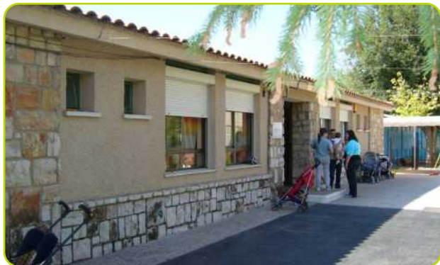
Exterior de las instalaciones de la Casa de Niños.

La Concejalía de Educación continúa trabajando para adecuar y facilitar los horarios escolares y tener servicios que faciliten la conciliación de la vida laboral y familiar. Por este motivo desde el pasado mes de mayo la Casa de Niños de Perales ha contado con un servicio de ludoteca gratuito para todos sus alumnos, el horario establecido han sido todas las tardes de lunes a viernes de 16:00 a 17:30h.