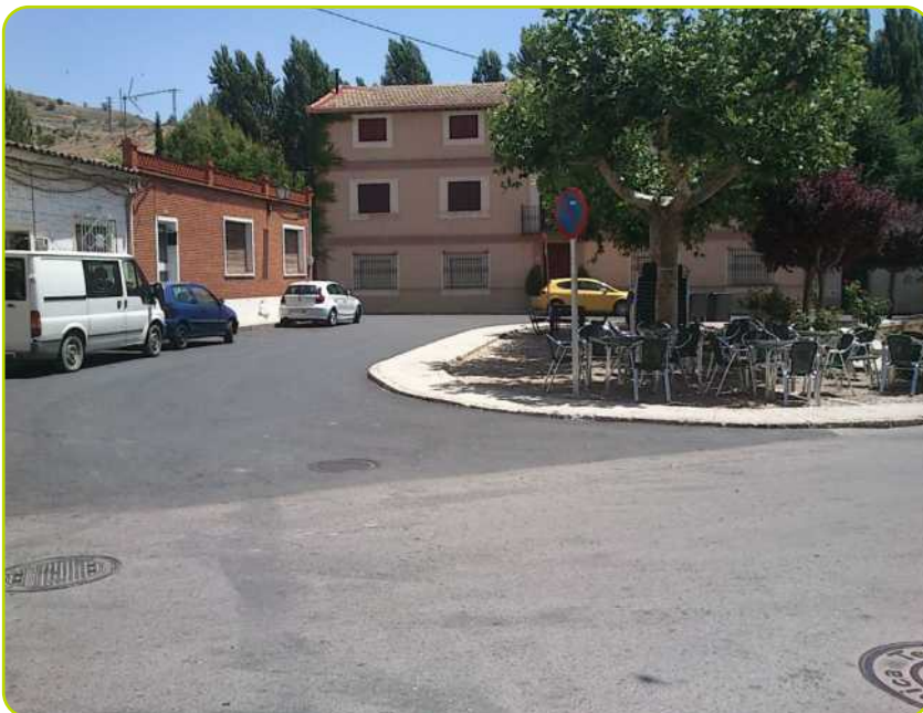
Detalle de tramo asfaltado en la conexión de la Plaza de la Mariblanca con la Calle Mayor Baja.

También se ha asfaltado la conexión de esta calle con la C/ Almendros , con la C/ Enmedio hasta C/ Cuatro Esquinas y parte de las Plazas del Matadero y de la Mariblanca .