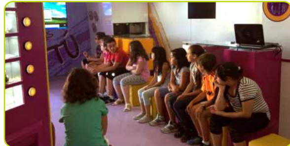
Jóvenes peraleños participaron en las actividades de Prevención “Drogas o Tú”

El pasado mes de mayo visitó Perales el Servicio Itinerante de Prevención de las Adicciones “Drogas o Tú”. Los niños de 5º y 6º de Primaria del Colegio Ntra. Sra. del Castillo participaron en las actividades propuestas por el servicio y la Concejalía de Educación y Juventud informó a todos los padres para que pasasen por la unidad móvil ya que este servicio está dirigido tanto a los jóvenes como a los padres y educadores para dar una información veraz y científica sobre las drogas, fortalecer la capacidad preventiva de las familias y promover una actitud de rechazo frente al consumo de drogas.